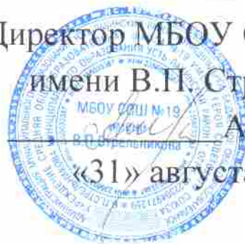
График для организации родительского контроля МБОУ СОШ №19 имени В.П. Стрельникова по столовой на 1 полугодие 2023 – 2024 учебного года